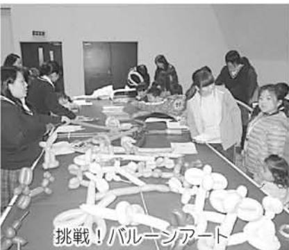
挑戦！バルーンアート

1月28日（日）宮之浦体育館で、高校生クラブぼんだま主催の「やくしまっ子」わんぱくフェスタ2013が開催されました。