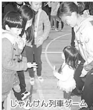
じゃんけん列車ゲーム

第20回「世界の屋久島」美術展実施要項では、巡回展示地域順を①安房②尾之間③宮之浦としていましたが、町総合センター（安房）の改修工事により、宮之浦と安房での展示を変更し、展示いたします。ご了承ください。