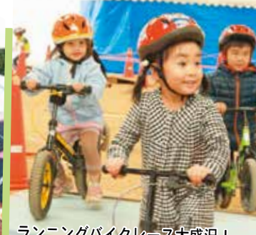
ランニングバイクレース大盛況!