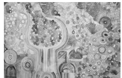
屋久島町長賞『one and one- 屋久島』