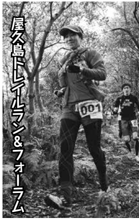
屋久島トレイルラン&フォーラム