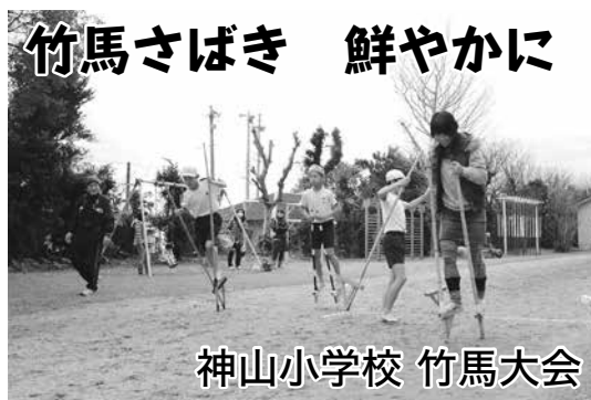
神山小学校 竹馬大会