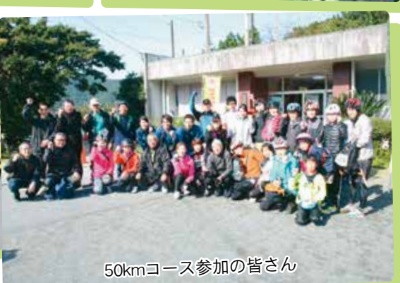
50kmコース参加の皆さん