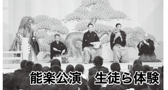
能楽公演 生徒ら体験

2月10日(月) 中央中学校で能楽公演があり、生徒たちは、日本の伝統芸能「能楽」への理解を深めるとともに、事前ワークショップで指導を受けた謡と舞を披露しました。