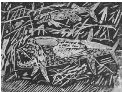
小学生上学年の部『大きな魚』