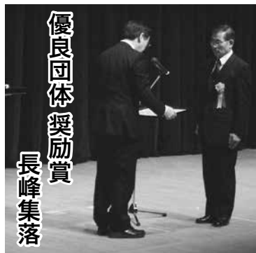
優良団体奨励賞 長峰集落

平成25年度の共生協働型地域コミュニティづくり推進優良団体表彰の奨励賞を、長峰集落が受賞しました。