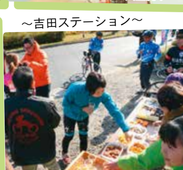
~吉田ステーション~