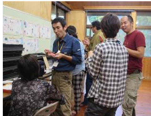
手作りの加工品やお菓子を手に参加者同志情報交換