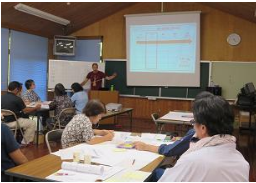
「アイデアワークシート(個人)として考えてみましょう」