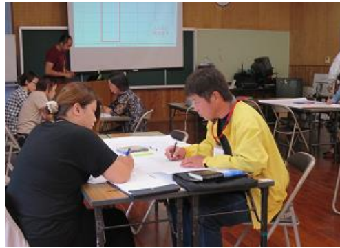
「アイデアワークシート(屋久島全体)について」 : 3班に分かれてグループワーク