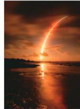
『このとりの巣立ち』 田宮光(平内)