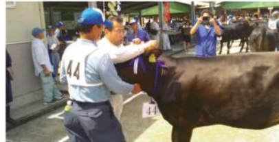
写真は熊毛地区畜産共進会