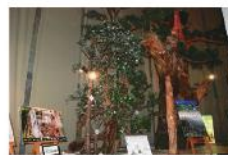
自然パノラマ館 1階