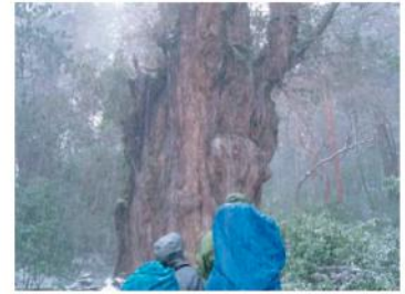
『縄文杉・冬』 菅文雄(船行)