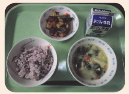
西部地区学校給食共同調理場

旬の食材を使ったおかずです。 ご家庭でもっと食べてほしい魚や いも、豆をくみあわせ、ご飯にあ りう甘辛い味付けにしています。 彩りがきれいで食欲をそそりま す。