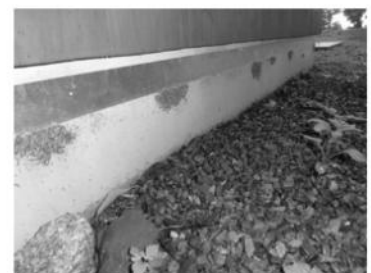
ヤステ返し設置状況

ヤステは表面がツルツルしたところでは進むことができません。アルミテープを家屋の壁面を囲うように張ることで侵入を防止することができます。