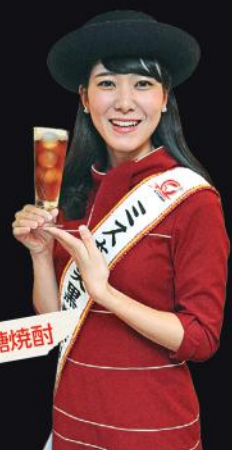
2015ミス奄美黒糖焼酎

「黒「糖」焼酎だから糖質が多い」とよく誤解されますが、本格焼酎は全て糖質ゼロ。ダイエットにも最適です。黒糖焼酎は奄美地方でしか造られない特別なお酒。すっきりした味わいで、どんな割り方も合います。私は紅茶割りでよく楽しんでますよ。