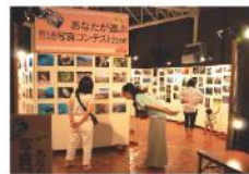
自然パノラマ館 2階

小杉谷事業所閉鎖から半世紀近く経つ今、後世に受け継ぐべき屋久島の一面をぜひご覧ください。