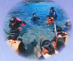
保護者主催 シュノーケリング体験授業

対象 ●屋久島への留学＝小学生のみ ●口永良部島への留学＝小学生及び中学生 募集期間 第1次:平成30年8月～平成30年10月末日(南海ひょうたん島留学は、11月末日) 第2次:平成30年12月～平成31年1月末日(1次募集で定員に満たない場合、2次募集を行います。) 募集定員 若干名 選考方法 面談の上、選考します。(各校区実施委員会の状況によります。)