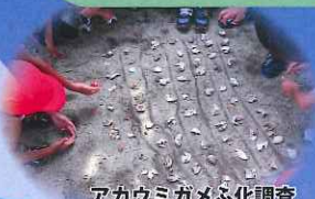
アカウミガメふ化調査