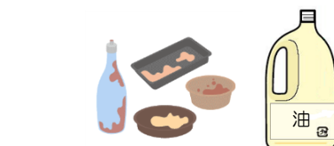
汚れがひどいプラスチック・ビニル類