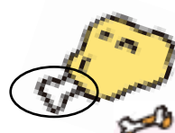
鳥の唐揚げなど骨