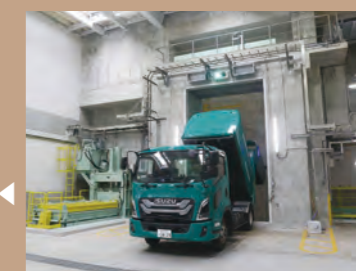
プラットホーム 運び込まれたごみは、プラットホームの投入扉からごみピットに投入します。