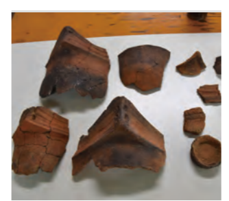
▲出土した縄文土器