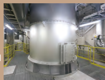
ガス冷却室 燃焼時に発生した高温の排ガスは、ガス冷却室で急速に冷却し、有害物質（特にダイオキシン類）の再生成を防ぎます。