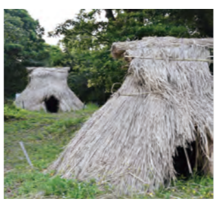
▲復元した竪穴住居

屋久島が誇る遺跡、横峯遺跡がこの度「屋久横峯遺跡」として町の史跡に指定されました。 屋久横峯遺跡は、春牧地区に所在する縄文時代後期(約3500年前)の遺跡です。これまでに5回の発掘調査が行われており、遺跡内からは縄文土器や石器といった遺物のほか、100基を超える大量の住居跡が見つかっています。 現地では遺跡の展示解説や再現された竪穴住居が見られますので、この機会にぜひご来跡を！