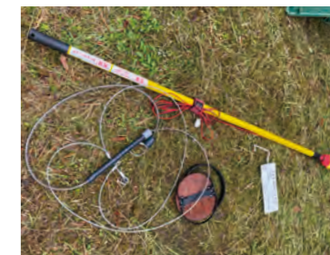
有害鳥獣捕獲わな一式 ▲

そういった事情から個体数を抑制し防除することが求められております。捕獲した動物の種類や頭数に応じて報酬金もあるため、それらを利用して口永良部島への定住・定着が行えるよう引き続き有害鳥獣駆除を頑張っていきたいと思います。