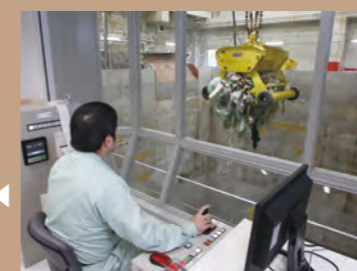
ごみピット ごみピットに貯留されたごみを、ごみクレーンで攪拌し、均質化した後、ごみ投入ホッパに投入します。