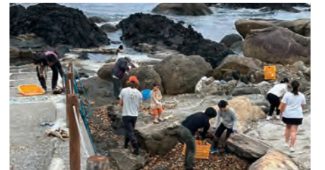
▲平内集落での海岸清掃の様子

れ、町民約520人が参加、合計約2.1トンの海岸ごみを回収しました。 海岸祭りは毎年開催されており、町民の皆さんも、屋久島の海辺の環境を守るため、どうぞご協力ください。