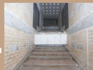
焼却炉 様々なごみ質に対応し、850℃以上の高温で焼却を行い、ダイオキシン類の発生を抑制します。