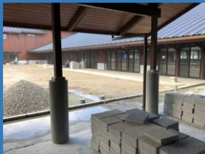
フォーム棟から中庭側