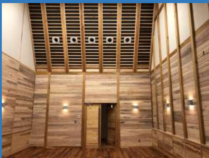
委員会室 (中庭側から)