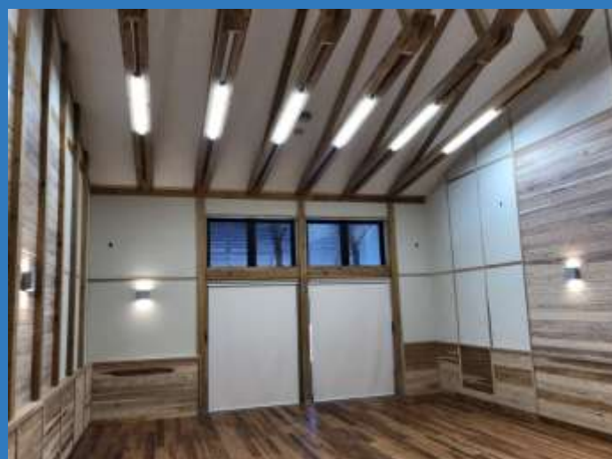
委員会室 (入口側から)